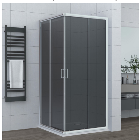
Profilo Cromo - Vetro Grigio Fumè