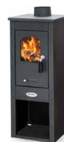
412-VLMAR-NE Nero Antracite